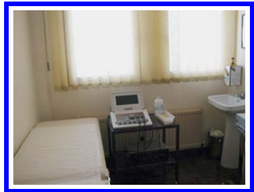
Corrientes media y baja frecuencia