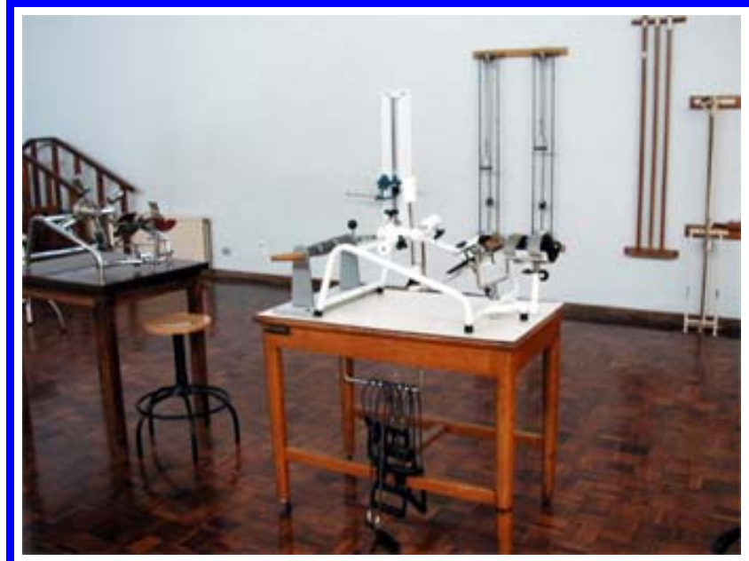
Mesa de brazos