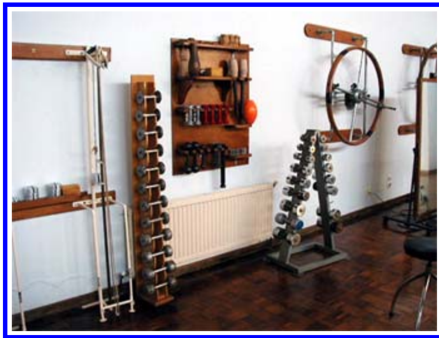
Mancuernas, rueda hombro y pesas