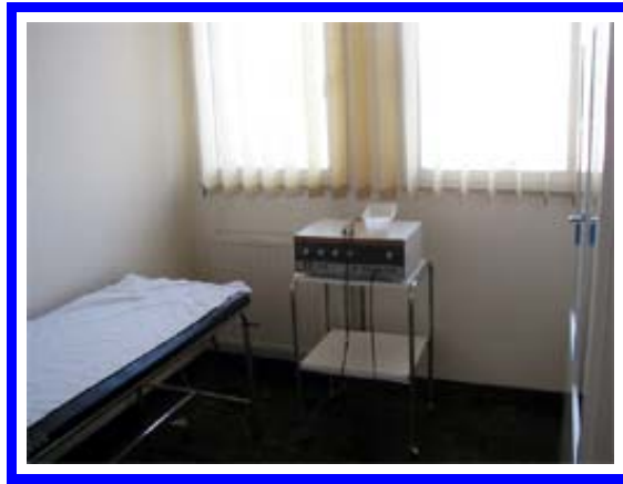
Corrientes baja frecuencia