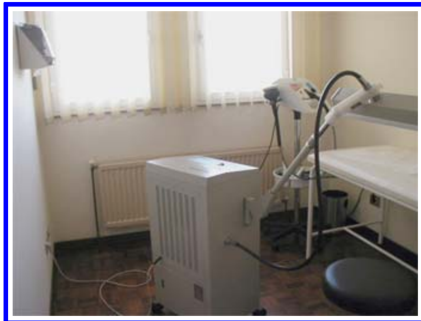
Micro-ondas con equipo de masaje